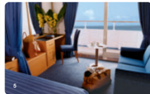
1. Celebrity Xpedition στα νησιά Γκαλαπάγκος 2. Discovery Lounge 3. Εστιατόριο Darwin's Restaurant 4. Καμπίνα με θέα προς τη θάλασσα 5. Σουίτα Xpedition